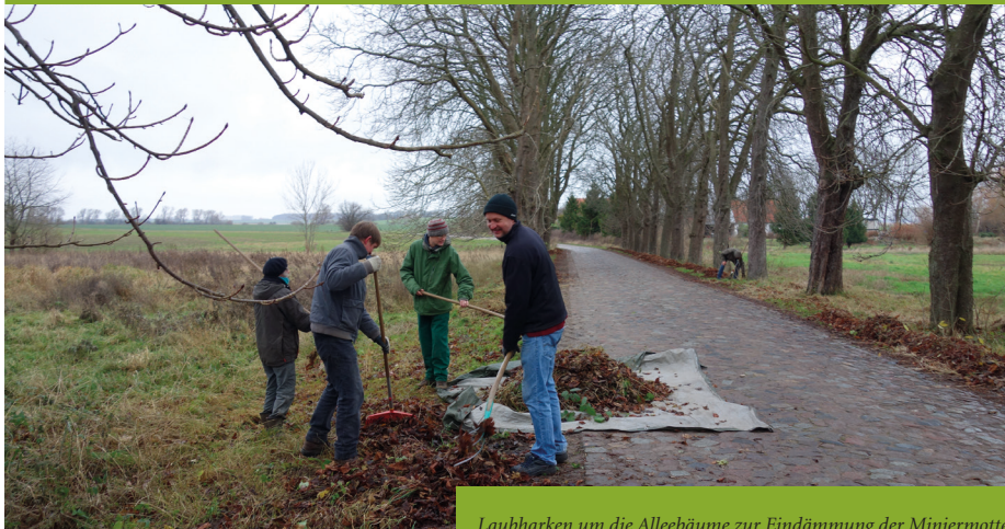
Laubharken um die Alleebäume zur Eindämmung der Miniermotte.